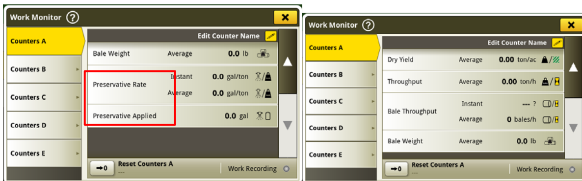
Visibile e nascosto